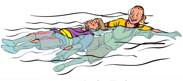
Voor 12 euro per jaar ben jij ook een Jonge Redder bij de KNRM!

De KNRM heeft voor kinderen tot 13 jaar de jeugdclub Jonge Redders. Wil je lid worden? Vul dan de aanmeldkaart in met je ouders en stuur hem op. Of meld je aan via www.knrm.nl/jeugd . Als lid van de club krijg je vier keer per jaar een mooi informatiepakket en gratis toegang tot het Reddingmuseum in Den Helder.