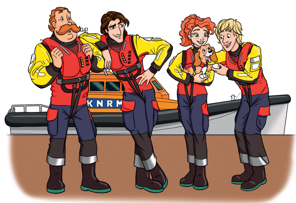
Knip de kaart uit en stuur op naar KNRM, Antwoordnummer 507, 1970 WB IJMUIDEN.