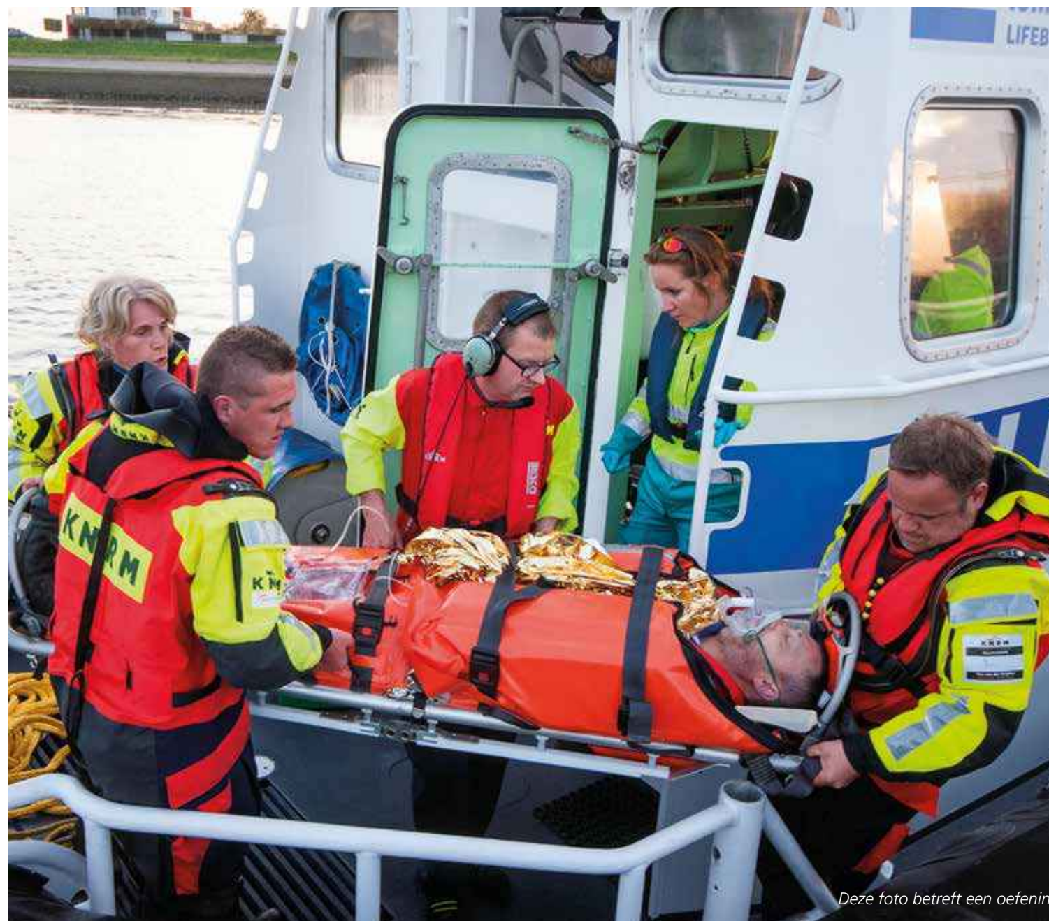
Deze foto betreft een oefening.