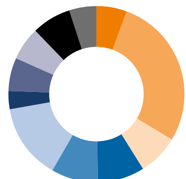
Waarvoor kwam de KNRM in Zeeland in actie in 2020?

De reddingstations Westkapelle en Cadzand beschikken over een halfopen reddingboot die door middel van een speciale lanceerinstallatie de zee in wordt gereden. Als laatste zijn er nog de ruime binnenwateren bij Neeltje Jans en Veere die bediend worden met een open reddingboot. Door de spreiding van de reddingstations en het materieel zorgt de KNRM er op deze manier voor dat iedereen rondom Zeeland verder van het water kan genieten. Gaat er toch iets mis? Dan is de hulp van de KNRM dichtbij.