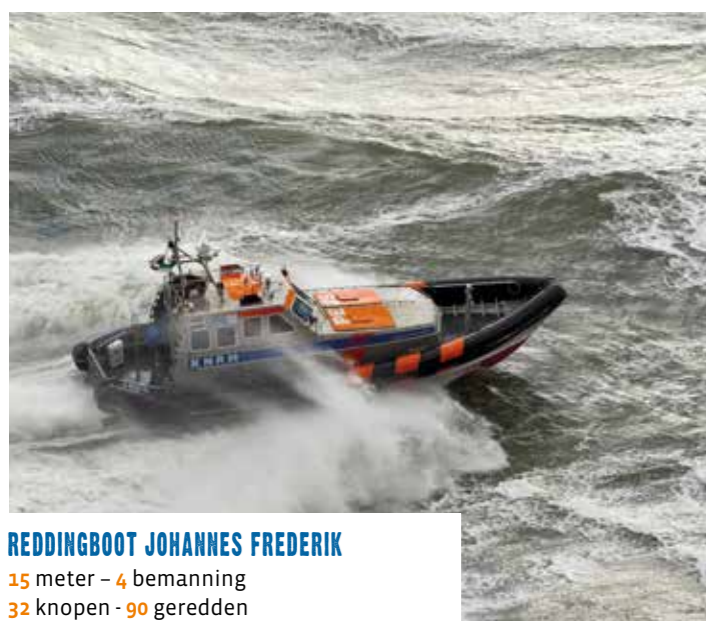
REDDINGBOOT JOHANNES FREDERIK 15 meter - 4 bemanning 32 knopen - 90 geredden