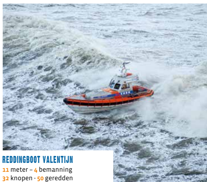
REDDINGBOOT VALENTIJN 11 meter - 4 bemanning 32 knopen - 50 geredden