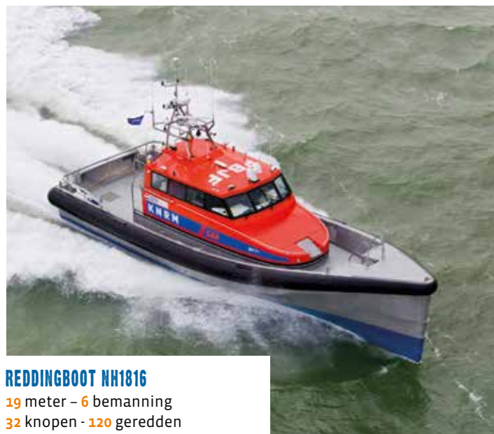
REDDINGBOOT NH1816 19 meter - 6 bemanning 32 knopen - 120 geredden