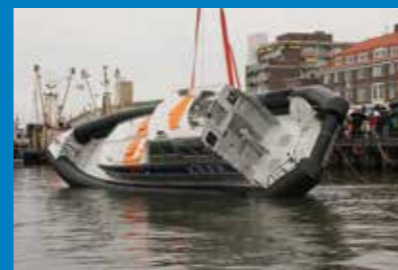
REDDINGBOOT NIKOLAAS 9 meter - 4 bemanning 32 knopen - 20 geredden