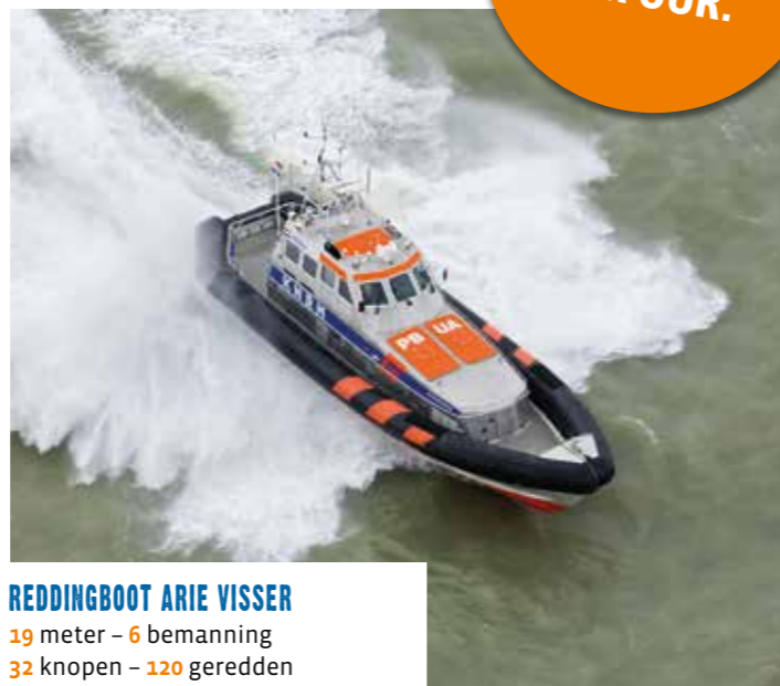
REDDINGBOOT ARIE VISSER 19 meter - 6 bemanning 32 knopen - 120 geredden